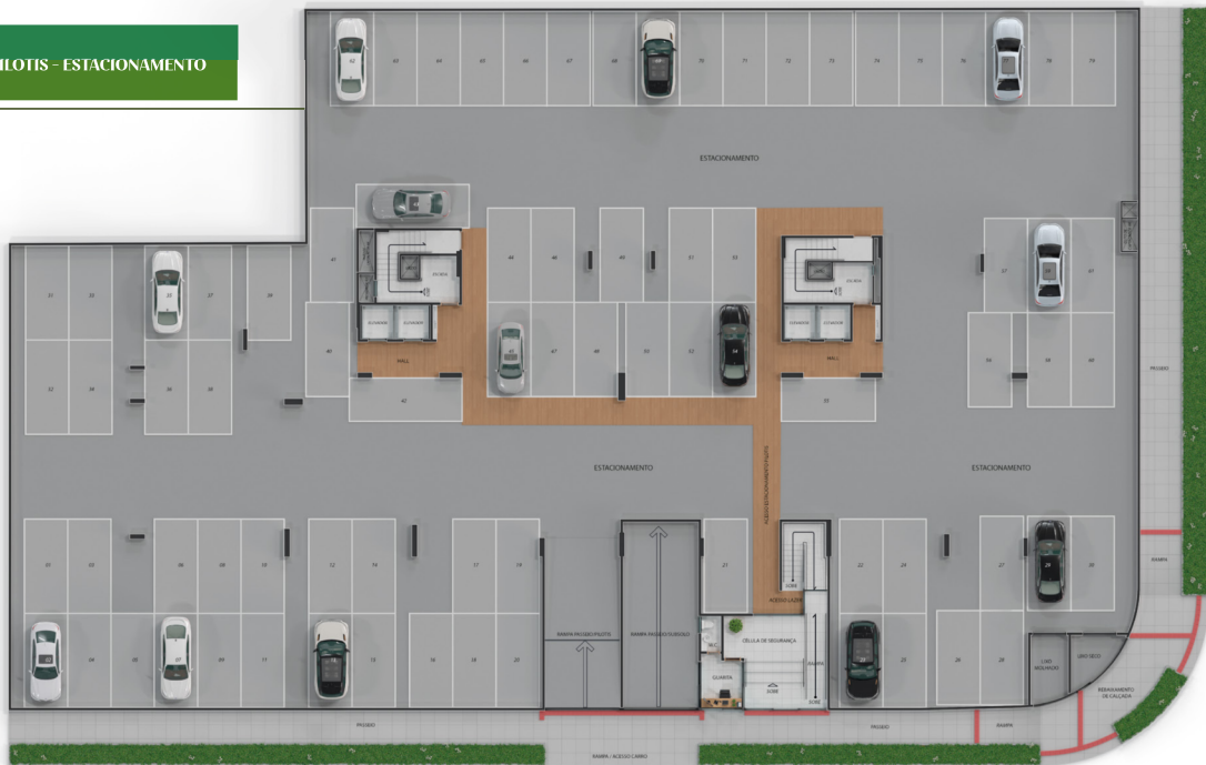
AV. HAMILTON DE BARROS SOUTINHO