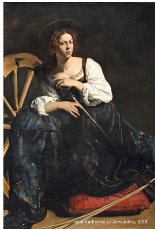
Saint Catherine of Alexandria, 1598