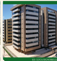
ED. LUCA SIGNORELLI