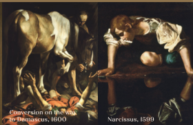
Conversion on the way to Damascus, 1600