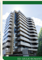
ED. GIULIO ROMANO