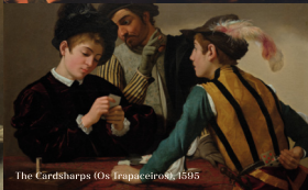
The Cardsharps (Os Trapaceiros), 1595