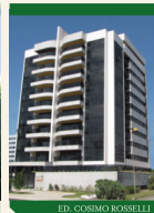
ED. COSIMO ROSSELLI