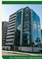
ED. FRANCESCO GRANACCI