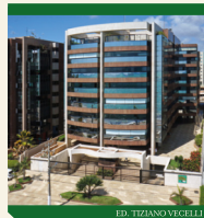
ED. TIZIANO VECELLI