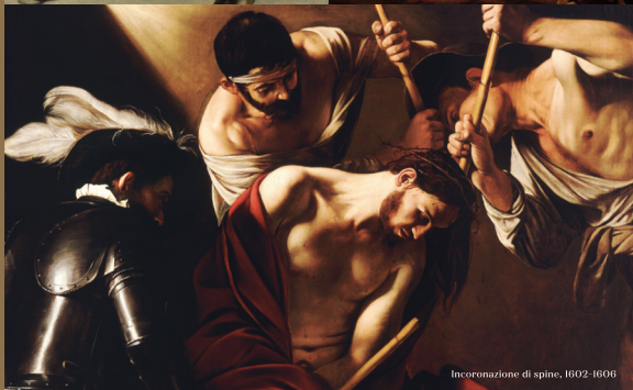
Incoronazione di spine, 1602-1606

“ Não sou um pintor valentão, como dizem. Mas um pintor valente, que sabe pintar e imitar bem as coisas naturais.”